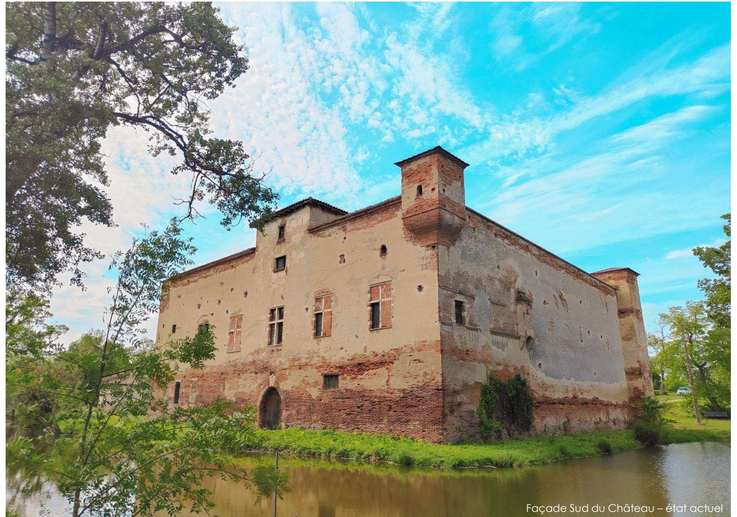
Façade Sud du Château – état actuel

De nos jours, le domaine de Candie est exploité par la Mairie de Toulouse qui y produit du vin, respectant ainsi une tradition vieille de plusieurs siècles.