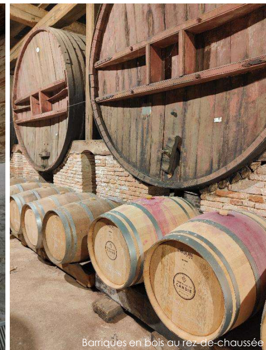
Barriques en bois au rez-de-chaussée