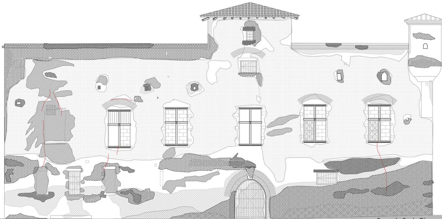
Façade Sud - Diagnostic