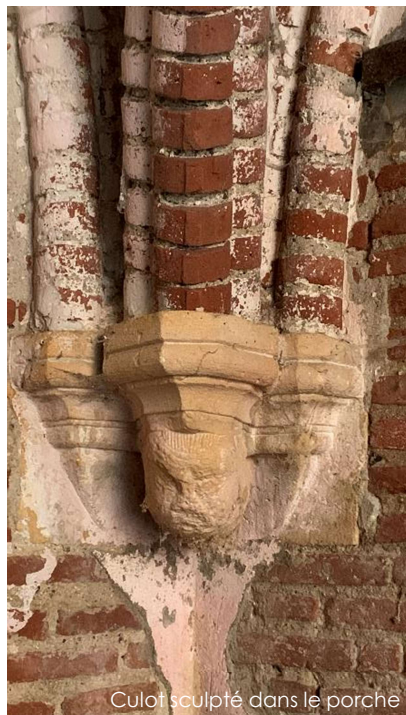
Culot sculpté dans le porche