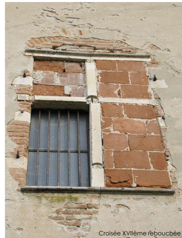
Croisée XVIIème rebouchée